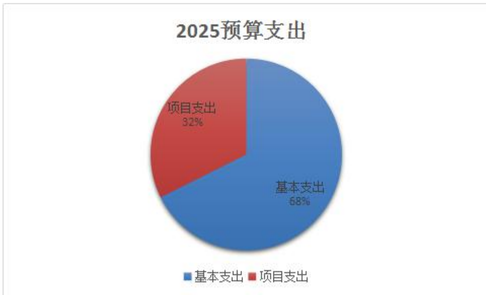
图 2. 支出预算图